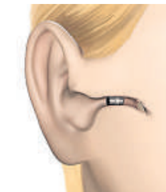
Ein Im-Ohr-Hörgerät ist von außen nicht sichtbar.

Aber: Neben dem Sehvermögen ist der Hörsinn das wichtigste Wahrnehmungsorgan, über das wir unsere Umwelt erleben. Dabei spielt das akustische Verstehen der Sprache eine besondere Rolle. Wer sein Gegenüber nicht mehr versteht, kann sich kaum noch an Gesprächen beteiligen. In vielen Fällen führt