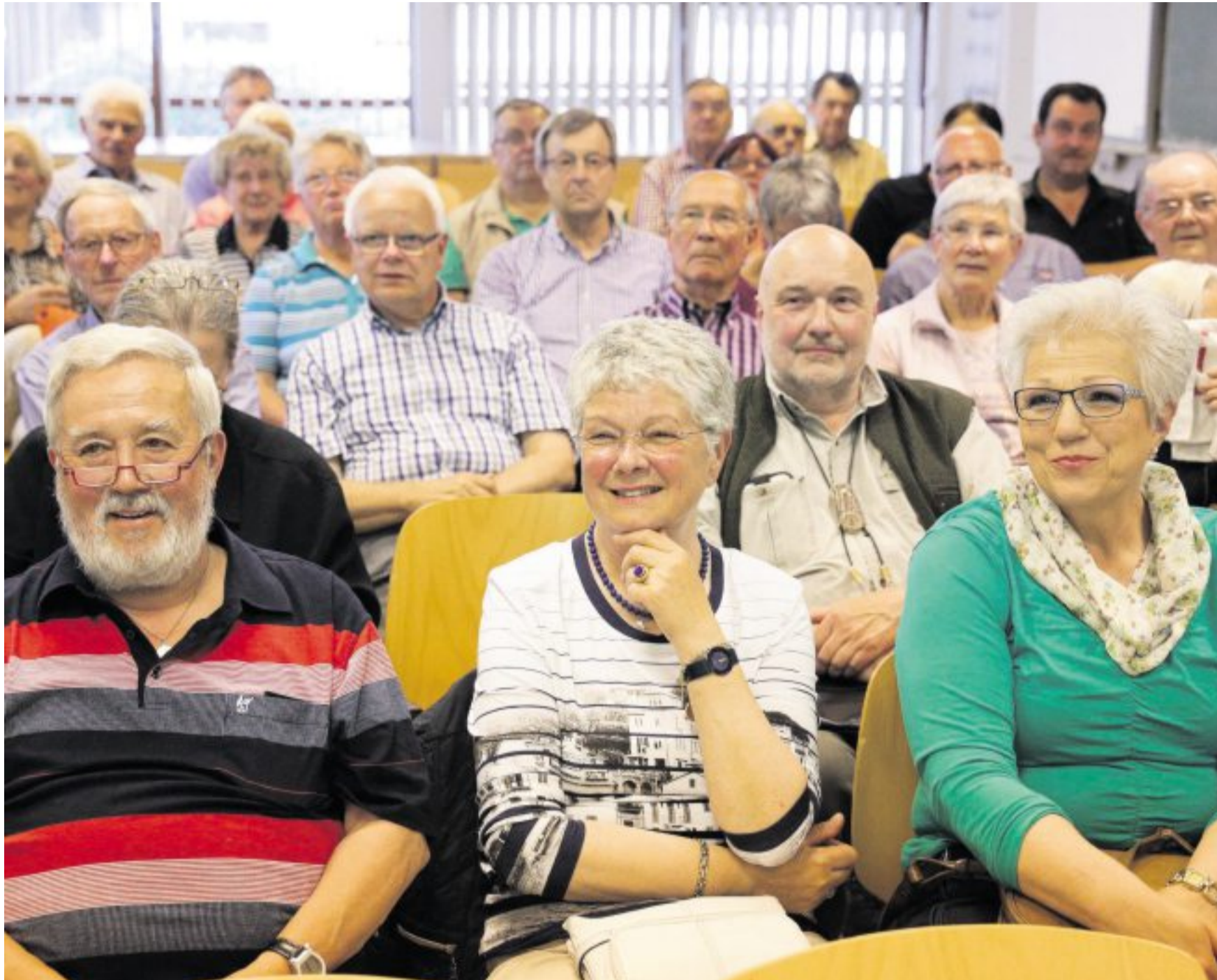
Was ist zu tun, wenn die Bauchwand bricht? – Diese Frage sorgte für einen voll besetzten Vortragssaal im Dattelner St. Vincenz-Krankenhaus bei der Abendsprechstunde des Medienhauses Bauer am vergangenen Montag.